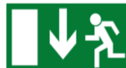
Notausgang (über dem Ausgang anbringen)