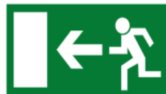
Richtungsangabe für Rettungsweg

Farbe der Schilder grün DIN 4844 Teil 2 Kontrastfarbe für Symbole weiß Randmaße Nach DIN 825 Teil 1 Mindestgröße der Schilder 200 x 400 mm