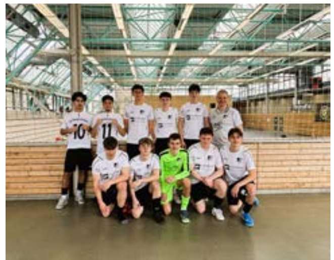
Unsere erfolgreichen B-Junioren nach dem entscheidenden Spieltag in RT-Betzingen

19:15 Uhr – Endspiel oder Spiel um Platz 3