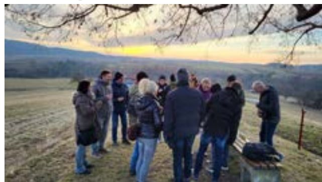
Toller Blick vom Maibühl