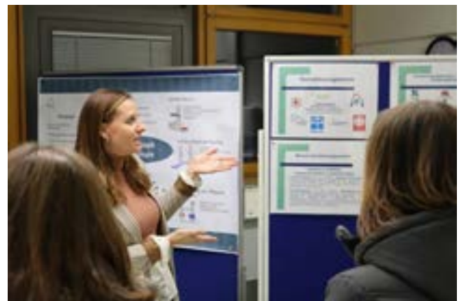
Am 6. Februar ist am BSZ Hechingen Berufsinformationstag

Der Berufsinformationstag am 6. Februar beginnt um 8.00 Uhr im Neubau des BSZ (Am Schlossberg 7). Vormittags richtet sich das Angebot vor allem an Klassen, ab Mittag sind auch bis 16.00 Uhr Eltern, Schülerinnen und Schüler herzlich eingeladen. Wer sich schon vorher informieren möchte, findet auf der BSZ-Homepage ( www.bsz-hechingen.de ) den Bildungsnavigator, der einen direkt zu den passenden Schularten leitet und über diese informiert.