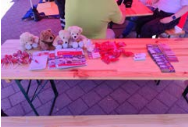
Kleine Dankeschön fürs Mitmachen.

Wir haben uns auch am 23.05.26 am „Mitmachtag“ beteiligt. Leider war die Beteiligung nicht so, wie wir gehofft hatten. Die Kinder hatten trotzdem Spaß beim Verbinden der Teddybären. Viele interessierten sich auch für die Wiederbelebungsmaßnahmen. Gerne können Interessierte bei der Jugendrotkreuz (JRK) Gruppenstunde Dienstags vorbeischaun. Wir würden uns sehr freuen.