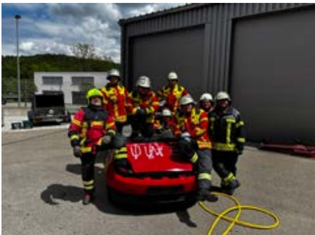
Team Rangendingen mit Ausbildern

Ein besonderer Dank gilt den Feuerwehr-Kreisausbildern des Landkreises Reutlingen , die den Lehrgang fachlich kompetent und engagiert durchführten.