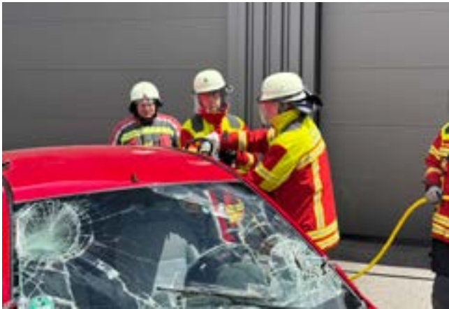
Arbeiten für eine große Öffnung

Die Ausbilder beobachteten die Teams genau, gaben Hinweise, korrigierten Abläufe und lobten die professionelle Zusammenarbeit innerhalb der Staffeln der beteiligten Feuerwehren.