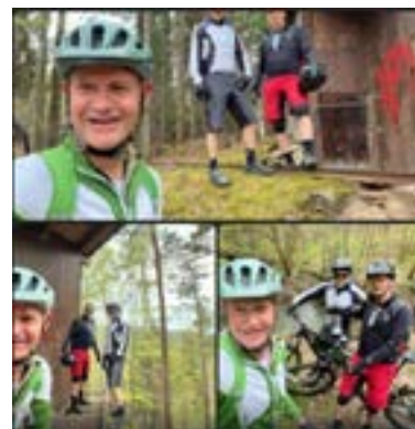
Tour am Sonntag (19.04.2026)