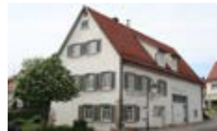
Das „Mahles Haus“ im Herzen Rangendingens ist seit 30 Jahren Heimat und Wirkungsstätte des Heimatvereins.

Diese Zahl verdeutlicht eindrucksvoll den Stellenwert der vielfältigen Kulturarbeit, die im Verein rund um das Museum geleistet wird. Diese kann in naher Zukunft sogar noch um eine weitere interessante Facette ausgebaut werden. Möglich könnte dies mit der geplanten Zusammenarbeit sowie möglichen Fusion mit dem Förderverein zur Renovierung der Klosterkirche werden, was derzeit diskutiert wird.