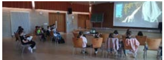
Filmnachmittag in der Aula