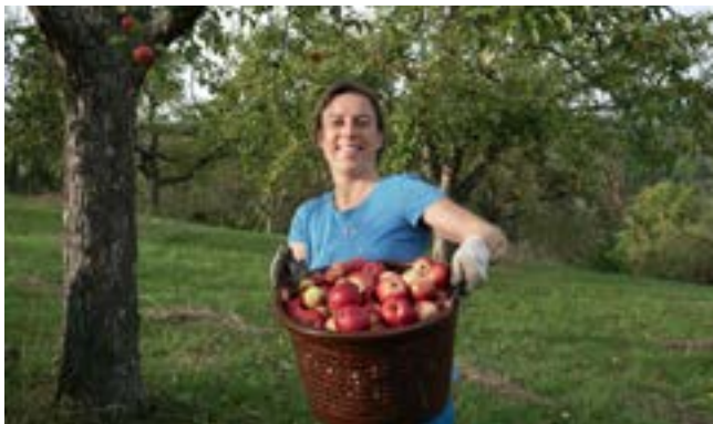
Foto: Geschmackliche Vielfalt: Tafeläpfel von der Streuobstwiese.

Schwäbisches Streuobstparadies Bismarckstrasse 21, 72574 Bad Urach Tel. 07125 309 3262 handelsplattform@streuobstparadies.de www.streuobstparadies.de www.handelsplattform-streuobst.de