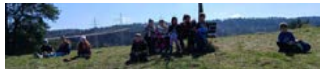
Pause nach dem langen Anstieg