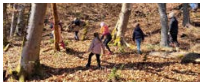
Ostereiersuche im Wald