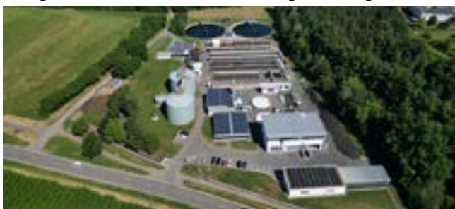
Blick von oben auf die Kläranlage Balingen; Fotografie: Paul Bossenmaier, Balingen, Copyright: Zweckverband Abwasserreinigung Balingen.

Zu den Aufgaben des Regierungspräsidiums Tübingen gehört die Erteilung von wasserrechtlichen Erlaubnissen für die Abwassereinleitung von kommunalen Kläranlagen mit mehr als 100.000 Einwohnerwerten. Darüber hinaus ist das Regierungspräsidium für die finanzielle Förderung von kommunalen Abwasservorhaben nach den Förderrichtlinien Wasserwirtschaft sowie von privaten und kommunalen Vorhaben zur Abwasserbeseitigung im ländlichen Raum nach den Grundsätzen des Ministeriums für Umwelt, Klima und Energiewirtschaft Baden-Württemberg zuständig.