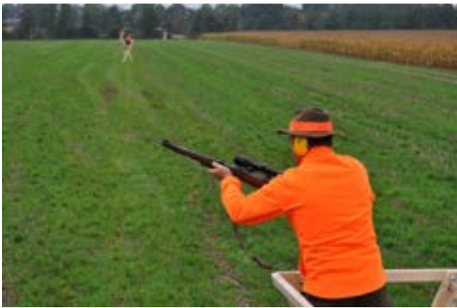
Ein wirksamer Kugelfang durch erhöhte Ansitzeinrichtungen und begrenzter Schussentfernung machen Erntejagden bedeutend sicherer.

Weitere Hinweise und Empfehlungen finden sich in der SVLFG-Broschüre „Sichere Erntejagd“. Sie kann unter www.svlfg.de und mit dem Suchbegriff „B44“ kostenlos aus dem Internet heruntergeladen werden. Druckexemplare können telefonisch unter 0561 785-10339 oder online unter www.svlfg.de/broschueren-bestellen angefordert werden. Die Unfallverhütungsvorschrift Jagd findet sich unter dem Suchbegriff „VSG 4.4“.