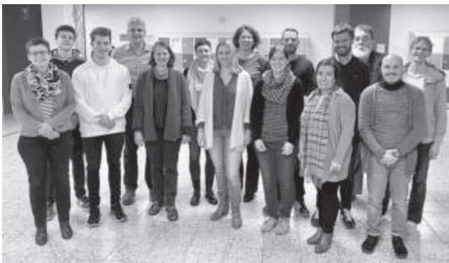
Ausschuss des Fördervereins auf dem Gruppenbild (von links):

Insgesamt kann der Förderverein auf ein erfolgreiches Jahr zurückblicken, ist personell und finanziell gut gerüstet und kann somit sehr positiv in die Zukunft blicken.