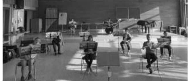
Das Bild zeigt die Musikerinnen und Musiker der 3. Klasse.

Seit 14. Juni 2021 dürfen die beiden Orchester der Bläserklassen-AG in der Grundschule in Rangendingen wieder proben.