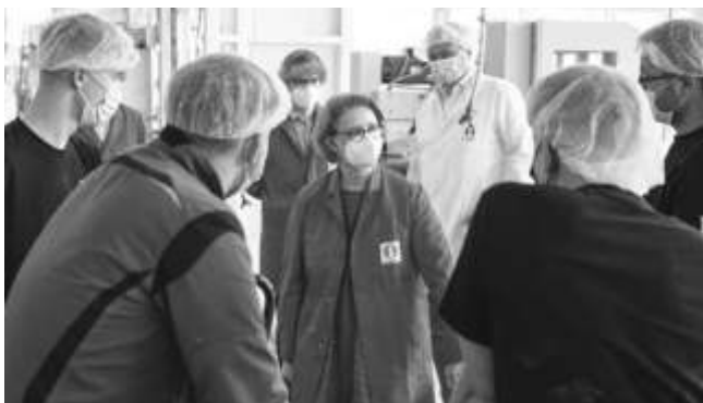
Austausch von Staatsministerin Annette Widmann-Mauz MdB mit Mitarbeiterinnen und Mitarbeitern der Tubex GmbH im Werk Rangendingen

Beide Unternehmen zeigen auf beeindruckende Weise, was an Innovation und Qualität vor Ort entsteht. Dabei setzt die Tubex GmbH bei der Herstellung von Verpackungen für Kosmetik, Pharma, Lebensmittel und technische Produkte auf den Faktor Nachhaltigkeit. Durch energieeffiziente Lösungen wie der Wärmerückgewinnung werden bis zu 50 Prozent CO 2 eingespart. Auf die Zukunft setzt das Werk in Rangendingen auch im Bereich der Ausbildung. Mit fünf verschiedenen Ausbildungen, vom Industriemechaniker bis zum IT-Kaufmann, schafft die Tubex GmbH Perspektiven für junge Menschen in der Region. Mit ihren Verbesserungen der Reinigungstechnologie im Bereich der Medizintechnik sorgt die 3mach GmbH dafür, dass die Hygiene im Gesundheitssystem wirtschaftlicher gestaltet und gleichzeitig die Umwelt entlastet werden kann. Die Innovationskraft des Unternehmens spiegelt sich auch im Firmengebäude wider. Mit transparenten schwingenden Wänden, die das Sonnenlicht so durchlassen, dass Pflanzen optimiert wachsen können, verbindet das Gebäude Natur- und Arbeitswelt.