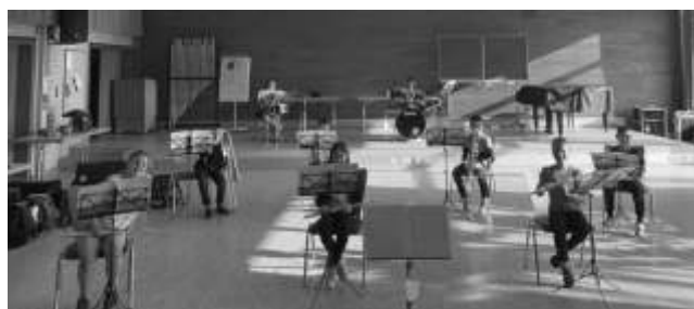
Das Bild zeigt die Musikerinnen und Musiker der 3. Klasse.

Seit 14. Juni 2021 dürfen die beiden Orchester der Bläserklassen-AG in der Grundschule in Rangendingen wieder proben.