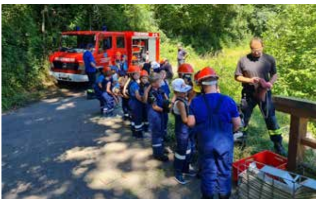
Aufbau der Saugleitung

In zwei Gruppen wurden Saugschläuche gekuppelt. Einen Saugkorb angebracht und es wurde erklärt welchen Zweck dieser Saugkorb hat. An dem Saugkorb wurde von den Löschzwerge eine Ventilleine angebracht, welche nach dem Löscheinsatz gezogen wird, damit sich die Leitung entleeren kann um dann die Saugleitung aus dem Wasser heraus holen zu können. Dann wurde die Saugleitung mit einer weiteren roten Arbeitsleine gesichert. Einige von den Löschzwerge konnten auf Antrieb den richtige Knoten "Zimmermannsschlag" am Saugkorb anbringen.