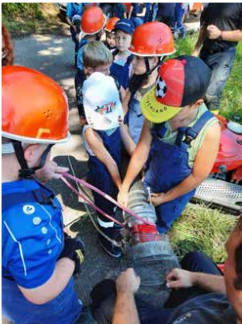
An der Saugleitung wurde der Saugkorb angebracht und nun wird die Sicherungsleine angebracht