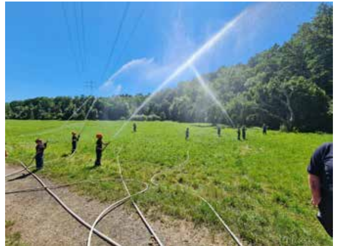
Wasser Marsch der Löschzwerge

Von 4 Betreuer wurde aus einem Löschfahrzeug die Tragkraftspritze entnommen und am Ufer der Starzel aufgestellt, die Saugleitung angekuppelt und der Motor gestartet. Gemeinsam bauten wir von der Pumpe eine Schlauchleitung mit B-Schläuchen zum Verteiler auf. An dem Verteiler haben die Löschzwerge ihre Schläuche angekuppelt und einen Löschangriff mit mehreren Rohren vorgenommen.