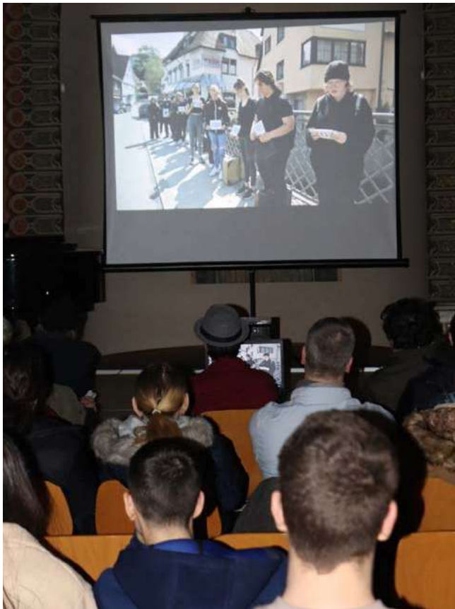
Im Mittelpunkt der Gedenkstunde stand der von Schülerinnen und Schülern gedrehte Film über die Deportation der elf Hechinger Jüdinnen und Juden am 27.11.1944