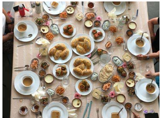
Bild: Türkisch für Anfänger - Mezze

Schwäbisches Streuobstparadies e.V. Bismarckstrasse 21, 72574 Bad Urach, Telefon: 07125 – 309 32 63 e-mail: kontakt@streuobstparadies.de www.streuobstparadies.de