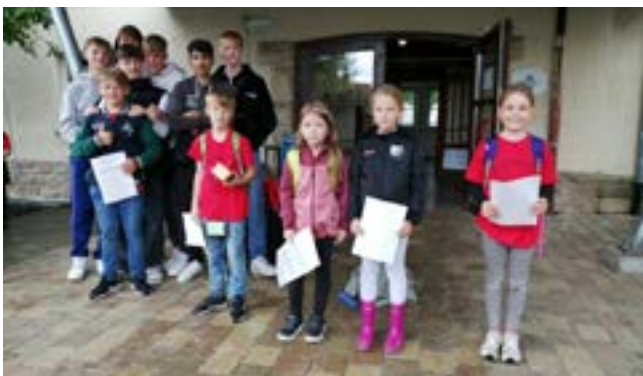
unsere diesjährige/r Bürgermeister/in mit ihrer Stellvertretung

Das Kinderspieldorf eröffnete zum 5. Mal seine Tore für alle Bürger und Bürgerinnen.