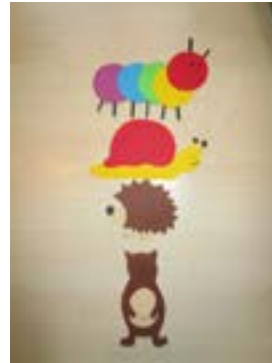
Raupe, Schnecke, Igel und Krümel

Heute findet bei uns im Kindergarten unser alljährliches Verwandlungsfest statt.