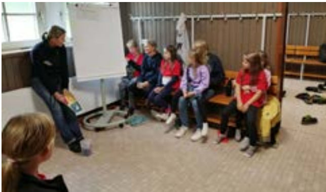
neue Spielstelle: Rangengcity-Uni