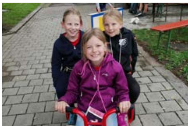
neue Spielstelle: Rangdengcity-Taxi