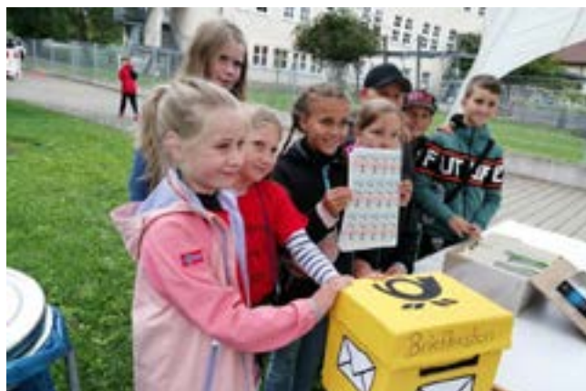
neue Spielstelle Post

Das Kinderspieldorf „Rangdengcity“ für Kinder im Alter zwischen 7 und 12 Jahren fand in der 5. Ferienwoche, vom Montag, 28. August bis Freitag, 01. September 2023 statt.