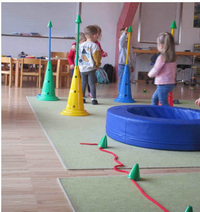
Die Kinder bauen den Parcours um