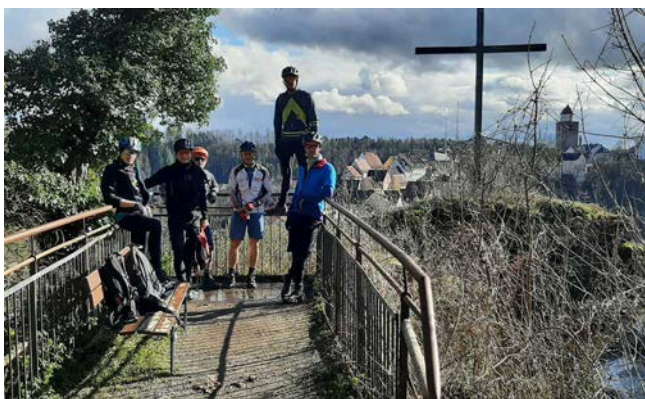
Kurze Pause mit Blick auf Haigerloch

Diesmal führte die Tour in nach Haigerloch und Umgebung. Auf gut zu befahrenden Wald-, Wiesen- und Teerwegen ging es zunächst nach Haigerloch-Stetten. Von dort nach Haigerloch am Schloss vorbei bis nach Bad Immnau.