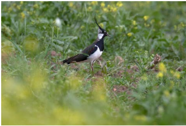
Kiebitz; Fotografie: Heiner Götz.