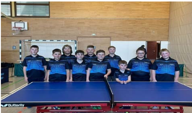
Die Spieler des TTC Rangendingen

VdK-Ortsverband Rangendingen SOZIALVERBAND VdK