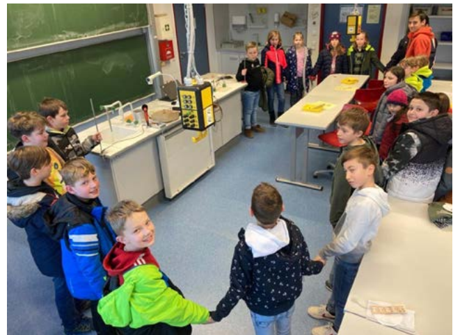
Stromkreis mit Menschenkette

Zwei Jahre lang konnten sich Eltern und Kinder nur online über die Angebote am Gymnasium informieren, dieses Jahr war endlich wieder ein Offener Nachmittag live möglich. Entsprechend groß war der Andrang am Freitagnachmittag, als die Viertklässler der umliegenden Grundschulen und deren Eltern Gelegenheit hatten, das Gymnasium kennenzulernen, um eine Entscheidungshilfe für die zukünftige Schulwahl zu haben.