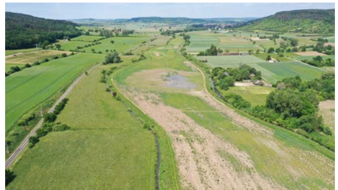
Wiedervernässte Ackerflächen im Ammertal; Fotografie: Regierungspräsidium Tübingen.

Nicht nur um die Rinder an Ort und Stelle zu halten, sondern auch um den Kiebitz und seine Nester zu schützen, wird die Weidefläche umzäunt. Die Graswege in diesem Bereich können dann nicht mehr begangen werden. Besuchende können sowohl die Kiebitze als auch die Rinder weiterhin von der Kiliansbrücke aus störungsfrei beobachten.