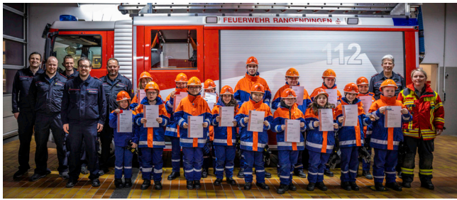
Gratulation! zur abgelegten Prüfung Jugendflamme 1