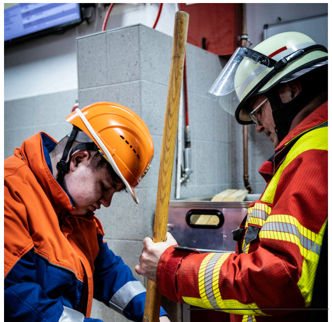
Knotenkunde: Sicherung eines Feuerwehrbeils ; z.B. um es in die Höhe zu ziehen