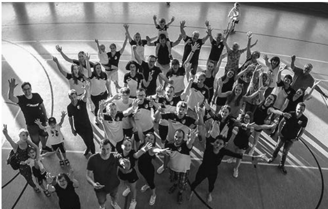
Das war ein gelungener und toller Tag. Eure Abteilung Turnen des SV Rangendingen

Die Turngala am vergangenen Samstag in der Turn- und Festhalle Rangendingen war ein voller Erfolg. Ein herzlicher Dank geht an alle Kinder und Jugendlichen, für ihre Vorführungen. Ihr könnt stolz auf euch sein. Bedanken wollen wir uns auch bei den Übungsleitern, die sich die Vorführungen ausgedacht und mit den Gruppen einstudiert haben. Danke an alle Helfer für die tatkräftige Unterstützung und einen herzlichen Dank für die zahlreichen Kuchen Spenden.