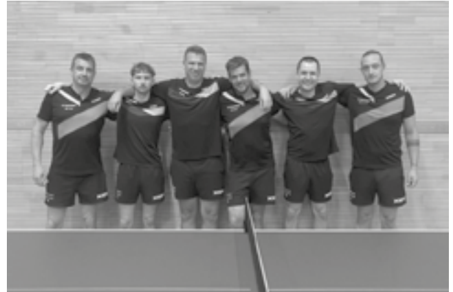
Die neu formierte 1. Herrenmannschaft des TTC Rangendingen