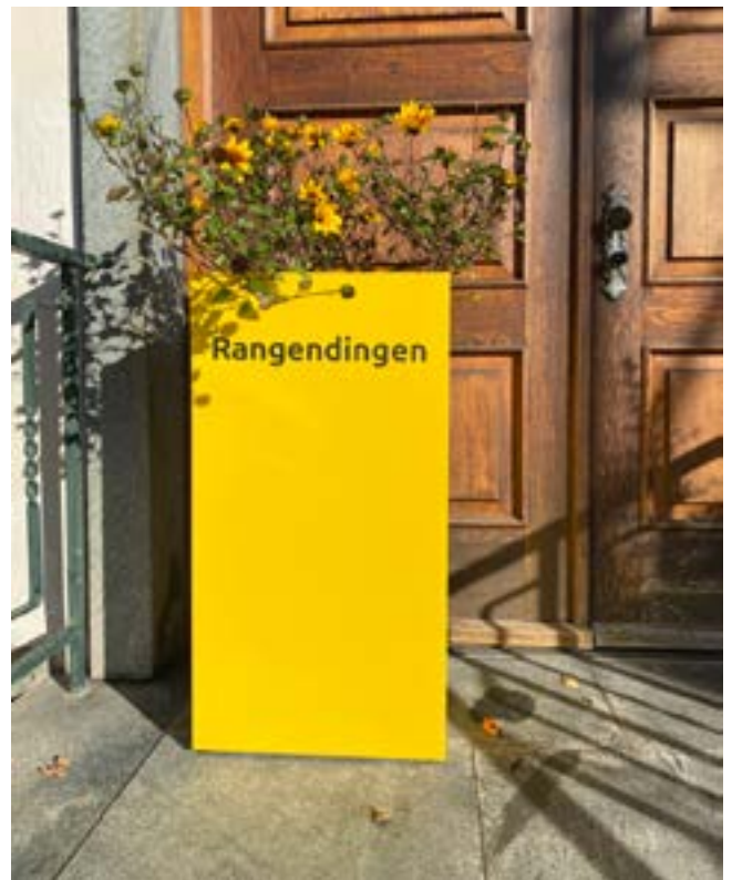
... jetzt vor dem Rathaus in Rangendingen.