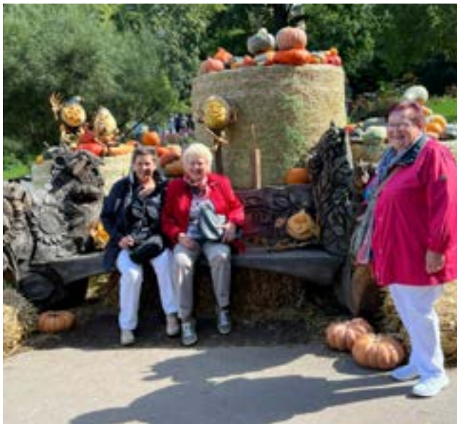
Eine kleine Verschnaufpause eingelegt.

Alle waren sich einig wieder einen schönen und gemütlichen Ausflugstag erlebt zu haben.