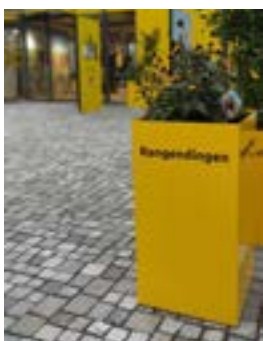
Die Pflanzsäule auf der Gartenschau in Balingen und ...

Die Pflanzsäule der Gemeinde Rangendingen, die beim Pavillon des Landkreises Zollernalb auf der Gartenschau in Balingen gestanden ist, ist nun vor dem Rathaus aufgestellt worden. Nachdem die Gartenschau ihre Türen am vergangenen Sonntag geschlossen hat, durften wir die Pflanzsäule übernehmen. Nun verschönert sie den Rathauseingang.